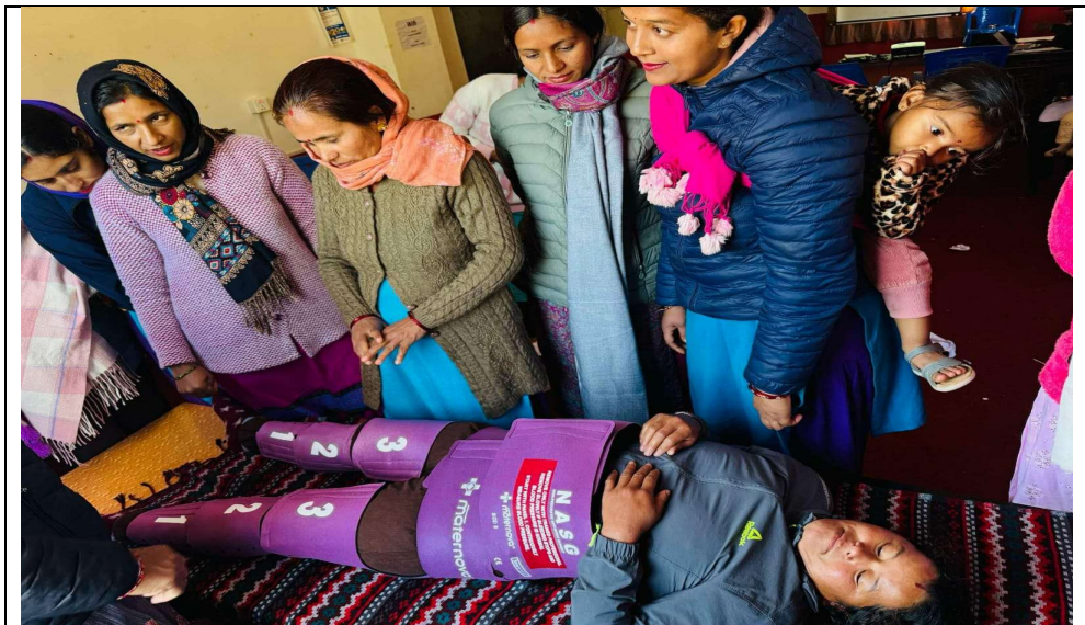
१२.२ NASG Demonstration

१३ .पालिका स्तरमा जन प्रतिनिधि र स्वास्थ्यकर्मीहरु लाई मानसिक स्वास्थ्य सम्बन्धि अभिमुखिकरण