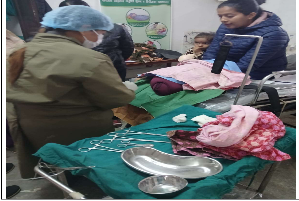
१४.१ घाटगाउँ स्वा चौ मा MNH Onsite Coaching मा डेमो देखाउदै प्रशिक्षक