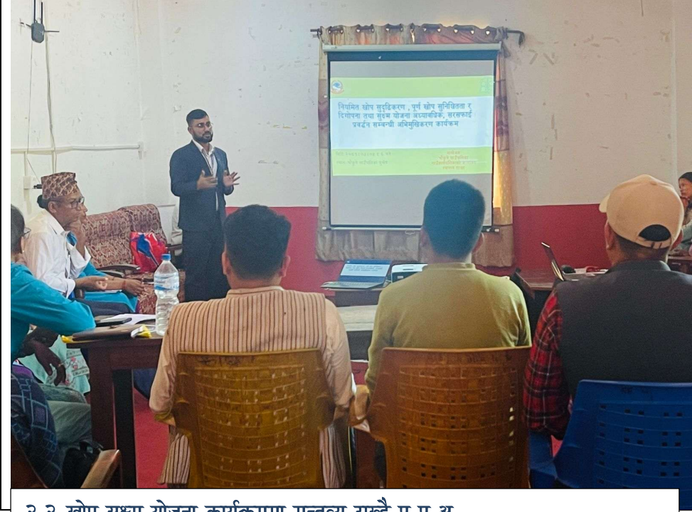
२.२ खोप सुक्ष्म योजना कार्यक्रममा मन्तव्य राख्दै प्र प्र अ