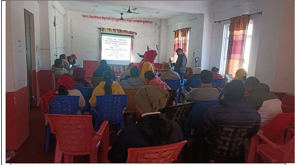
५.१ मानसिक स्वास्थ्य सेवा सम्बन्धि अन्तरक्रिया कार्यक्रम संचालन