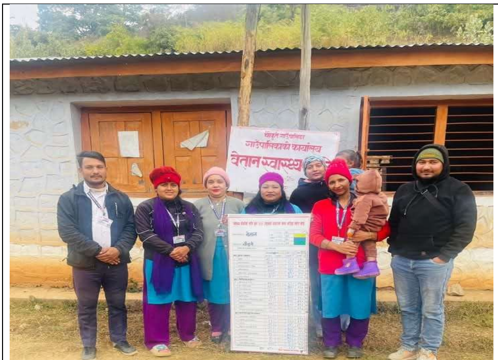
१५.१ बेतान स्वा चौ मा HPMS कार्यक्रम संचालन