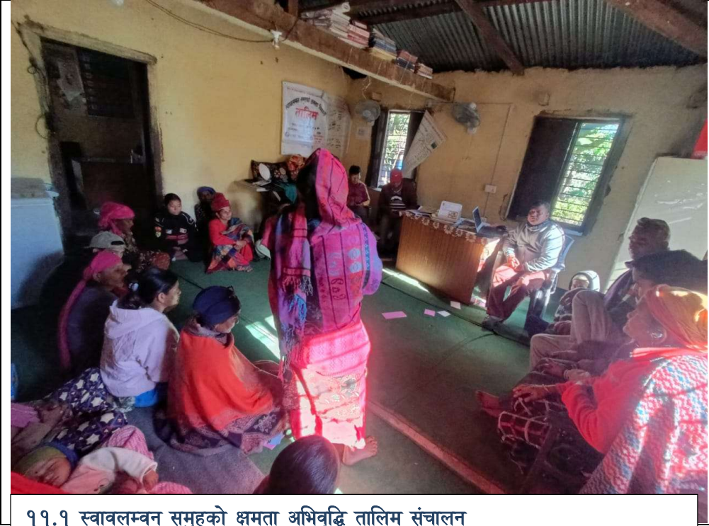
११.१ स्वावलम्बन समुहको क्षमता अभिवृद्धि तालिम संचालन