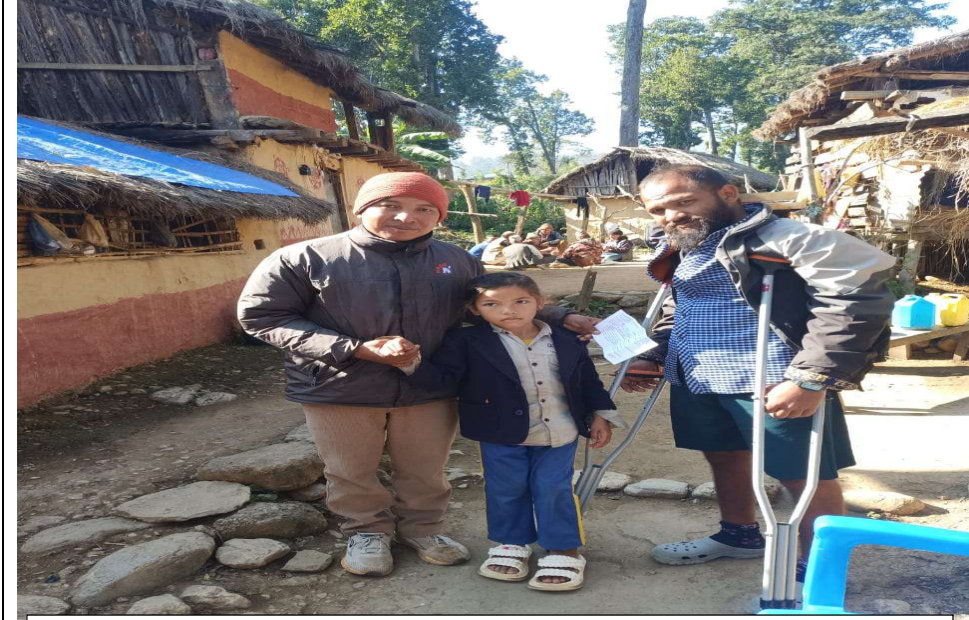
द.१ अपाङ्गता भएका बालबालिका पहिचान गर्दै