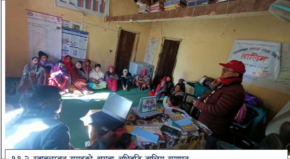
११.२ स्वावलम्बन समुहको क्षमता अभिवृद्धि तालिम समापन