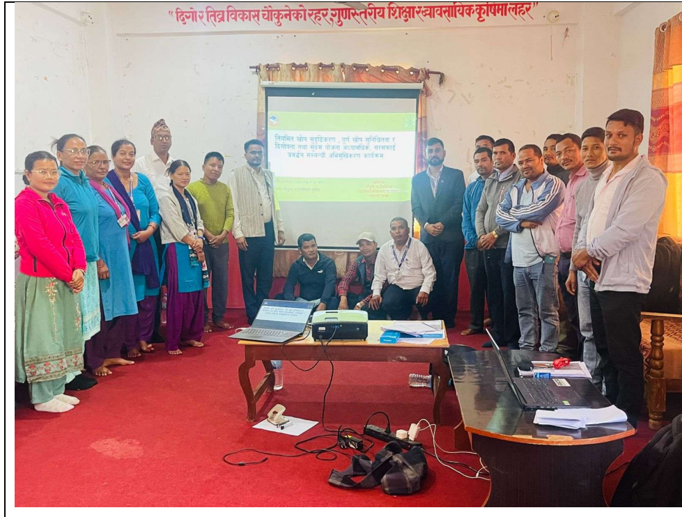
२.१ खोप सुक्ष्म योजना समापनको तस्विर