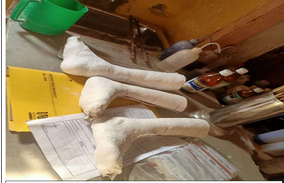
८.४ कृत्रिम खुट्टाका लागी नाप बनाउँदै