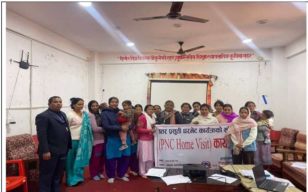
१२.१ उत्तर प्रसुती घरभेट समिक्षा कार्यक्रम समापन