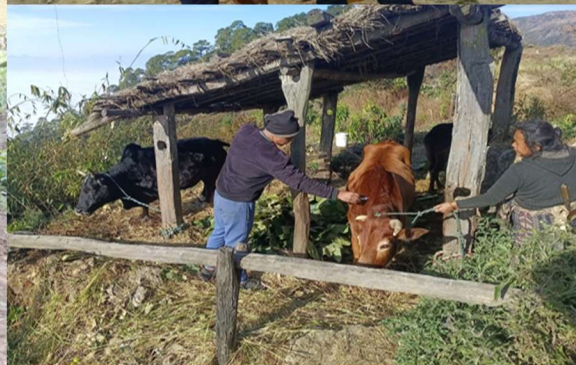
चौकुने ७ मा कृत्रिम गर्भाधानको काम