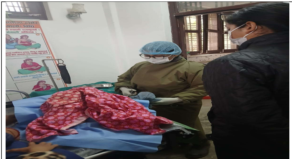
१४.२ घाटगाउँ स्वा चौ मा MNH Onsite Coaching मा डेमो देखाउदै प्रशिक्षक