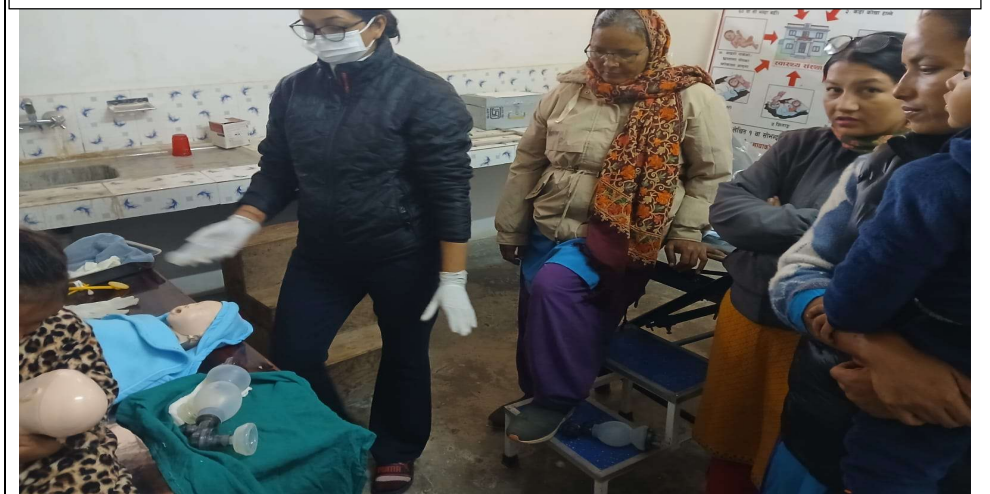
१४.३ घाटगाउँ स्वा चौ मा MNH Onsite Coaching मा डेमो देखाउदै प्रशिक्षार्थी