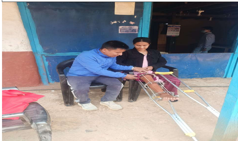
द.३ अप्रेसन पश्चात रिङ्गको अवलोकन गर्दै