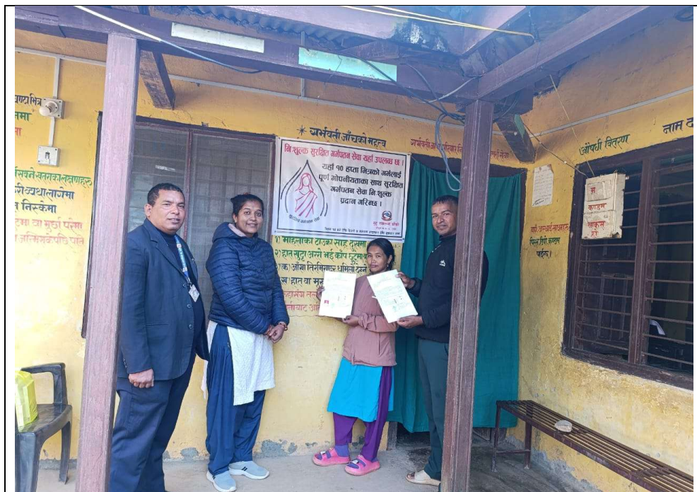
१०.१ गुटु स्वास्थ्य चौकीमा सुरक्षित गर्भपतन सेवा बिस्तार