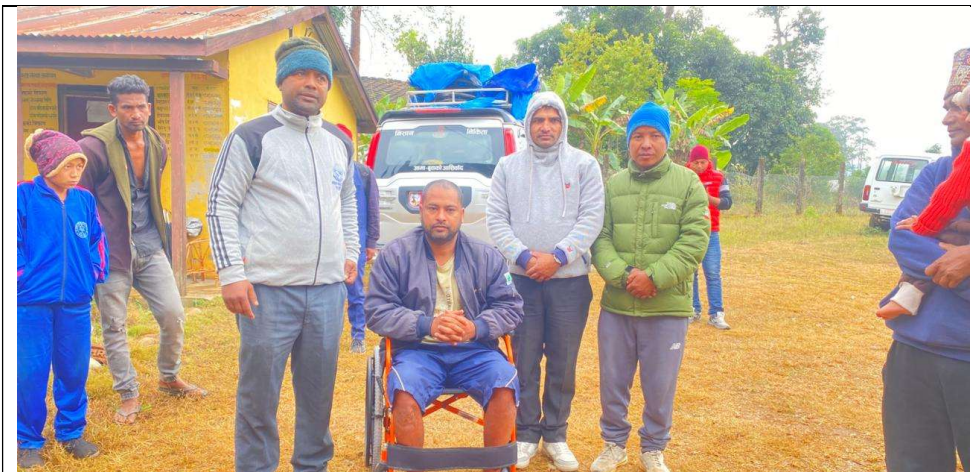
द.२ अपाङ्गता भएका ब्यक्तिलाई हिल चियर बितरण गर्दै गाउँपालिका अध्यक्ष