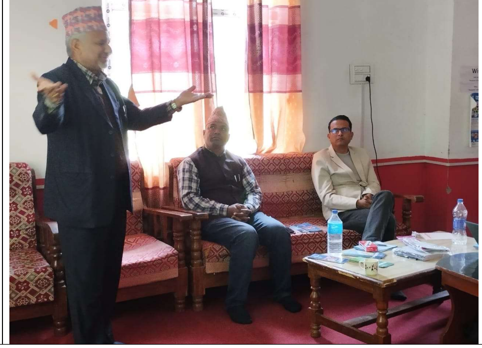
१३.१ मानसिक स्वास्थ्य अभिमुखिकरण कार्यक्रममा मन्तव्य राख्दै सामाजिक बिकास मन्त्रालयका सचिव ज्यू