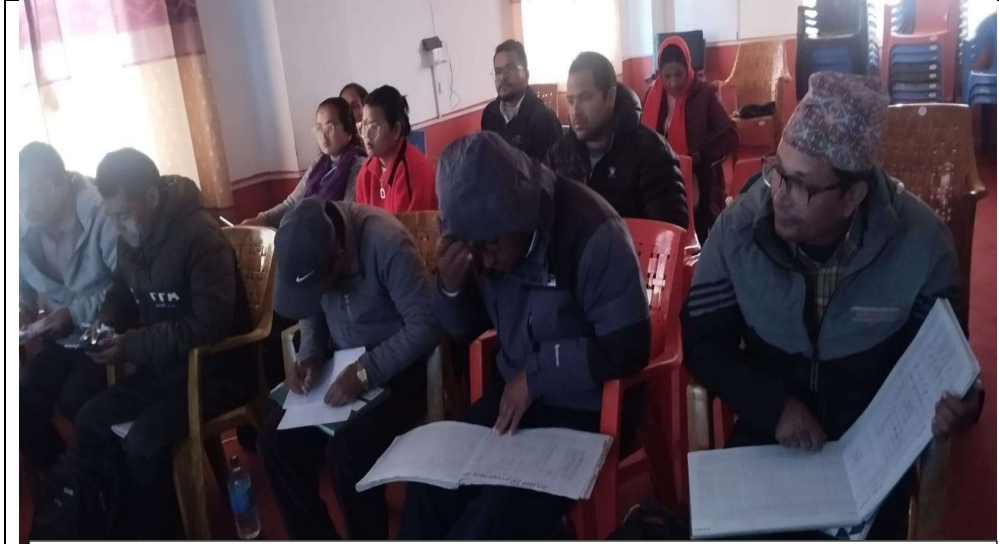
७.२ बिधालय स्वास्थ्य तथा पोषण कार्यक्रम संचालन